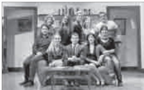
EL CASAMENT DELS PETITS BURGESOS